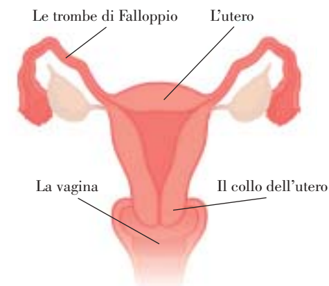
Gli organi riproduttivi femminili

La procedura Essure consiste nell'applicazione di un piccolo dispositivo flessibile, detto microdispositivo o microspirale, all'interno di ciascuna delle trombe di Falloppio. (Gli ovuli circolano all'interno delle trombe per passare dalle ovaie all'utero.) Dopo l'installazione dei micro-dispositivi, i tessuti corporei si sviluppano, per tre mesi, all'interno dei dispositivi stessi, ostruendo, in tal modo, le trombe di Falloppio. Tale occlusione impedisce allo sperma di fecondare gli ovuli ed evita, pertanto, la gravidanza.