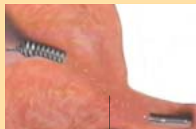
Il tessuto si sviluppa all'interno del microdispositivo Essure ostruendo la tromba di Falloppio