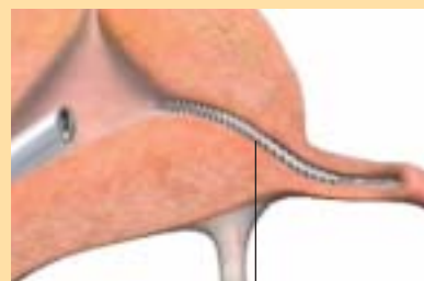
Microdispositivo Essure all'interno della tromba di Falloppio