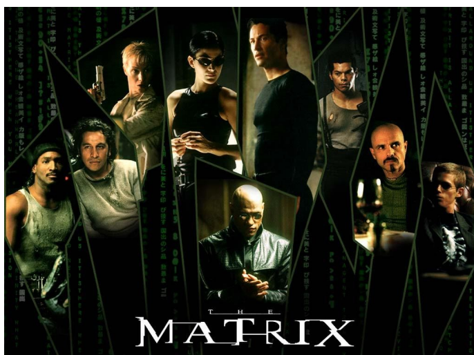
Matrix, Lana e Lilly Wachowski, 1999

Si comprende bene che non esiste un duce senza una massa di fascisti . “Date uno sguardo alla grande guerra, che continua a devastare l'Europa, pensate all'eccesso di brutalità, di crudeltà e di menzogna che può farsi largo nel mondo civile. Credete realmente che un pugno di arrivisti e di corruttori, privi di scrupoli, sarebbe riuscito a scatenare tutti questi spiriti maligni, se milioni di persone da essi trascinati non avessero la loro parte di colpa? ” (Sigmund Freud, Introduzione alla psicoanalisi , p. 120).