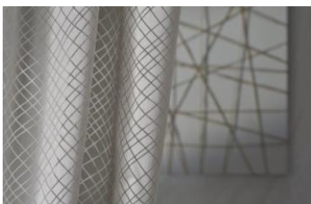
Tessuto Vega Variante colore col.30 Grigio Perla