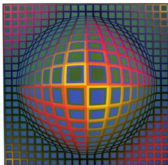
Vega-Nor di Victor Vasarely

Tendaggio devoré dalla fantasia geometrica per calate decorative moderne e luminose.