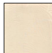
VENTAGLI cod. 83003