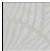
VENTAGLI col. 120