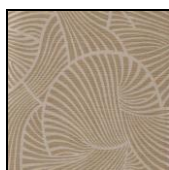
VENTAGLI cod. 83000