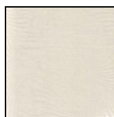
VENTAGLI cod. 83002