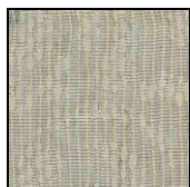
SAUVAGE col. 30