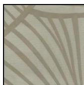
VENTAGLI col. 25