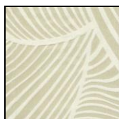
VENTAGLI col. 20