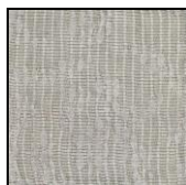
SAUVAGE col. 10