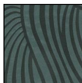
VENTAGLI col. 70