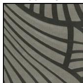
VENTAGLI col. 105