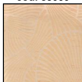
VENTAGLI cod. 83004