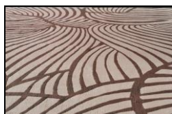
VENTAGLI cod. Rug. N. 10