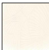
VENTAGLI cod. 83001