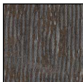
SAUVAGE col. 105